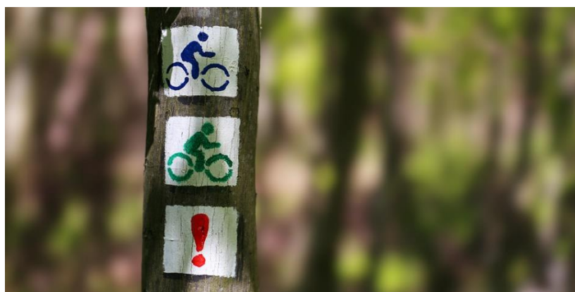
5. ábra: Erdei kerékpáros túraútvonal jelölése a Pilisben