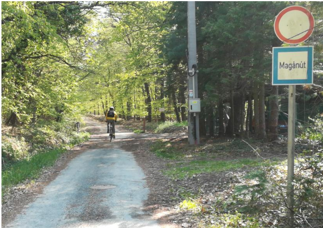
4. ábra: Közút és erdészeti út találkozási pontja a Szombathelyi Erdészeti Zrt. területén

A Vas megyei vizsgálat során több alkalommal is előfordult, hogy a felmérő személyzet olyan akadályba (kerítésbe, sorompóba) ütközött a projektben korábban kerékpártúrázásra kiválasztott erdei útszakaszon, amely meggátolta a továbbhaladást. Ezekben az esetekben a fizikai akadály egyben jogi akadályt is jelentett, ami azonban nem volt sem előzetesen, az odavezető úton, sem a helyszínen feltüntetve (bár egyelőre maguk az útvonalak sincsenek véglegesen kijelölve). Ezekben az esetekben a megoldást alternatív útvonal kijelölése jelentheti, továbbá a terület tulajdonosa is engedélyezheti a területen kerékpáros útvonal kijelölését.